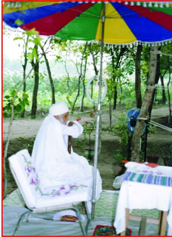
सन्त महाराज जी, तपोस्थान रतवाड़ा साहिब में समाधिस्थ अवस्था में

इसके बाद मैं अपने गांव आ गया, वहाँ पर भी मैंने अपना वही काम शुरू कर लिया। जब मैंने फौज में सर्विस की तो वहाँ पर भी यही काम करता रहा। जब मैं सिविल में आ गया यानि कि 1957 में सेक्रेटरीएट को ज्वाइन किया तो वहाँ पर भी मैंने नौकरी करने का ढंग बताया कि किस प्रकार से नौकरी की जाती है। मेरे पास परचेज ब्रांच थी, जिसमें लाखों रुपयों का कमीशन मिलता था। एक दिन की बात है कि