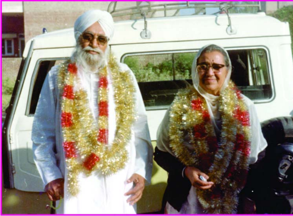
सन्त महाराज जी तथा सन्त माता जी 'एक अविस्मरनीय स्मृति'

दिल करता था, वहाँ चला जाता था। जहाँ दिल करता ठहर जाता था, मुझे कोई रोकता नहीं था। या तो मैं किसी गुरुद्वारे में ठहरता था, या फिर साधु के पास रहकर वहाँ कीर्तन सुनता रहता था, भजन पर बैठा रहता था। मुझे कोई पूर्ण साधु नहीं मिला था, जिसे मैं स्वयं को सौंप दूँ। क्योंकि मेरे अन्दर तर्क था, परख थी कि साधु कैसा होता है नहीं। मेरा नामधारी संतों के साथ भी काफी मेल-जोल रहा। नामधारियों के संत तो बहुत नाम जपते थे, सचमुच ही जपते थे। उनका भी असर मुझ पर था। महाराज से पूछने की बात ही नहीं थी, कि मेरे से क्या पूछा जाए? महाराज जी ने प्रश्न कर दिया। तीन मिनट बीत गये, महाराज जी कहने लगे बताते नहीं हो? मैंने कहा, जी! मुझे बताना नहीं आता। उन्हें पता चल गया और कहने लगे कि अच्छा बताओ कैसे नहीं बताना आता? आप हैरान होंगे कि ये कोई सयाने आदमी की बातें नहीं हैं। यह तो मूर्ख आदमी की बातें हैं। मैं इसीलिये कहता हूँ कि मुझे संसार का ज्ञान नहीं है। पता ही नहीं है कि यहाँ पर मेरा नुक्सान हो जायेगा, यहाँ पर कोई मुझे धोखा दे देगा अथवा कोई मुझे पकड़ा देगा। पता ही नहीं है इन बातों का।