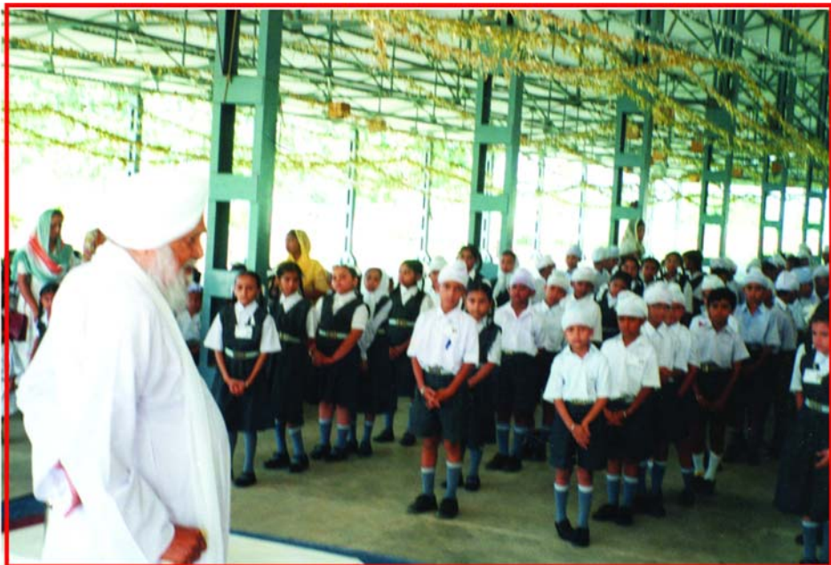
ट्रस्ट के संस्थापक महापुरुष 'गुरु गोबिन्द सिंह विद्या मन्दिर रतवाड़ा साहिब' के विद्यार्थियों को अपने प्रवचनों द्वारा श्रृंखला करते हुए